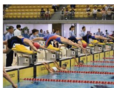
水泳競技での熱戦 (ひたちなか市)

1年後の茨城国体の成功に向け、各競技のリハーサル大会として位置付けた競技大会が、県内各地で始まっています。ぜひ会場で、アスリートたちの躍動を間近に感じながら、「チームいばらき」の選手を応援してください。