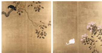
ひだしもんぞう からす 菱田 春草「猫に鳥」1910年 県近代美術館蔵

金は古くから美術品に用いられ、近代以降の作家も、伝統的な金の用法を学びながら新たな表現を開拓しました。華やかな金屏風から、金を効果的に用いた作品まで、その魅力を紹介しします。