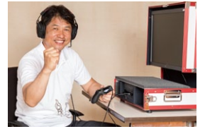
茨城国体ではeスポーツ大会も実施します！