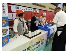
弓道競技の運営の様子 (水戸市)