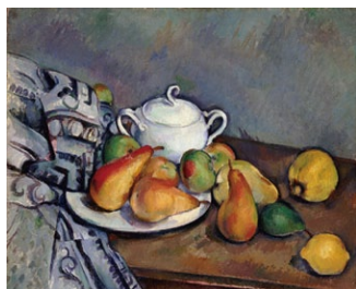
ポール・セザンヌ「砂糖壺、梨とテーブルクロス」1893-94年

「光の画家」モネが、明るい色彩によってまばゆい陽光下の積みわらを描いた輝かしい一作。