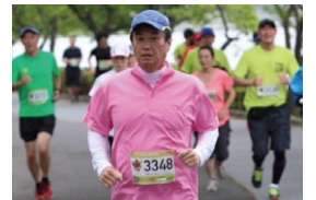
千波湖でも景色を楽しんで走りました！

趣味のジョギングは、茨城県に来てからも続けており、毎週末、那珂川の堤防や千波湖を、季節ごとの景色を楽しみながら走っています。昨年10月は水戸黄門漫遊マラソンに、今年は、1月から勝田マラソンに挑戦し、11月にはつくばマラソンに挑戦する予定です。茨城でマラソンをして一番魅力に感じたのは、沿道の皆さんからの応援でした。大きな声援や、寒い中で温かい飲み物の差し入れなど、茨城県のように温かく、親しみのある応援はなかなかありません。来年9月からの「いきいき茨城ゆめ国体・大会」では、皆さんの応援で、きっとたくさんのアスリートや県外から来られる応援者が、茨城ファンになると思います！