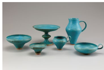
鈴木 麻起子「Turkish」2016-17年 個人蔵

本展では、作家の個性や現代の感覚が取り入れられた新しいスタイルの器(うつわ)を紹介しします。自分でも「使ってみたい」「飾ってみたい」と思う器が、きっと見つかる展覧会です。