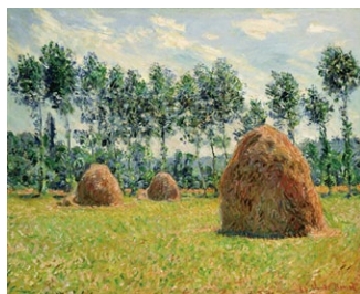
クロード・モネ「ジヴェルニーの積みわら」1884年

仕立屋、お針子の両親の元に育ち、流行のファッションに敏感だったルノワールの「レースの帽子の少女」は、ポーラ美術館の「顔」ともいえるべき逸品です。