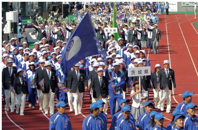
昨年の「笑顔つなぐえひめ国体」総合開会式

学生ジャーナリストは、若者目線による茨城国体・大会の情報発信を目的に、県内の高校生・大学生などで編成されるチームです。新聞社などのプロのジャーナリストの指導を受けながら、両大会に関連するスポーツイベントや芸術・文化事業などについて取材し、主にホームページで情報発信しています。