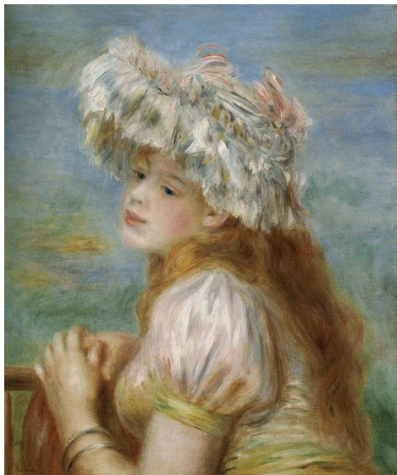
ピエール・オーギュスト・ルノワール 「レースの帽子の少女」1891年

ポーラ美術館の西洋美術コレクションは、国内随一ともいわれる質の高さを誇ります。本展では、モネやルノワールなど印象派の名品から、マティスやピカソらの20世紀絵画まで、選りすぐりの72点を紹介します。