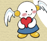
県人権啓発キャラクター ココロちゃん