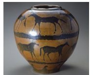
てつゆうももんおつづき 原清 鉄釉馬文大壺 (2005年当館蔵)

重要無形文化財「練上手」保持者の松井康成(1927-2003)と「鉄釉陶器」保持者の原清(1936-)の作品の魅力を紹介し