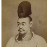
齊昭肖像画写真(当館蔵)

水戸藩9代藩主徳川齊昭によって創設され、日本遺産にも認定された弘道館と偕楽園は、齊昭の独創性が発揮された他に類を見ない施設です。齊昭に関する資料を交えて、その特色を紹介します。