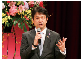
トークセッションでは有意義な意見交換をさせていただきました