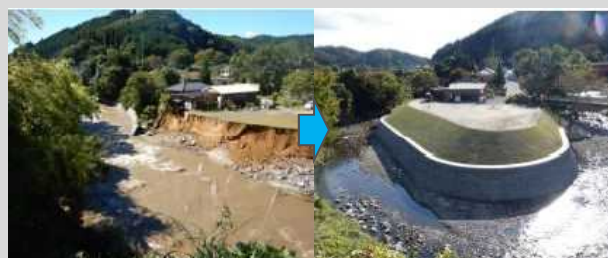
里川（日立市東河内町）