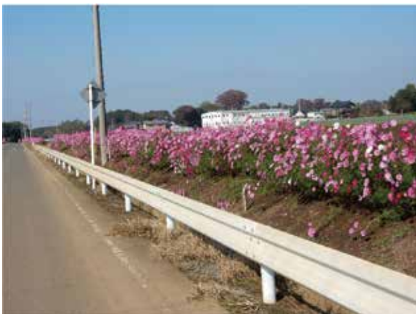
景観形成作物の植栽