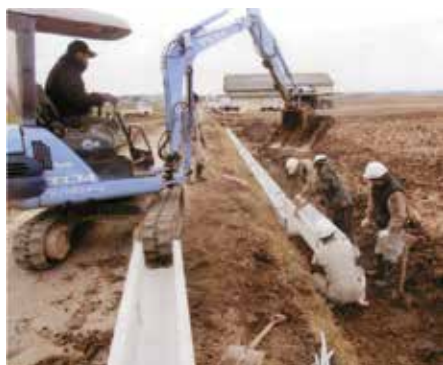
谷河原渋井資源保全向上活動会 (常陸太田市)