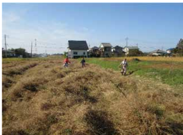
遊休農地発生防止のための保安全管理