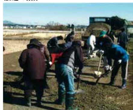
蓮沼・粟保全活動組織 (つくば市)