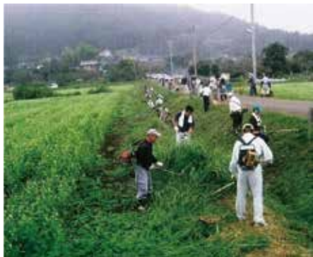
岩間上郷地域ホタル増やそうかい (笠間市)