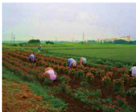
酒寄地区環境保全組合 (桜川市)