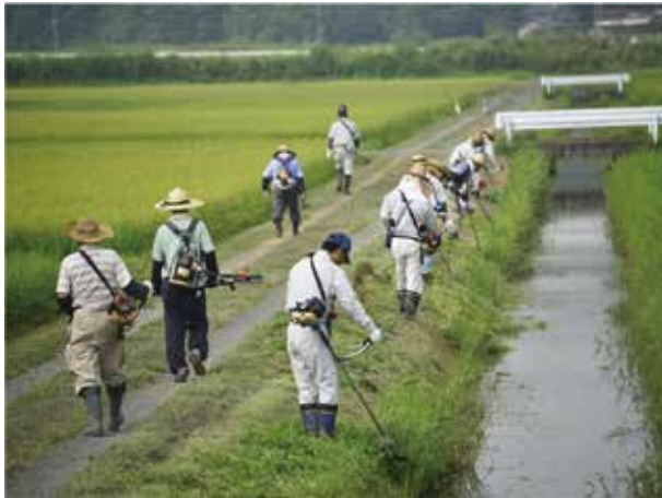
排水路法面の草刈り