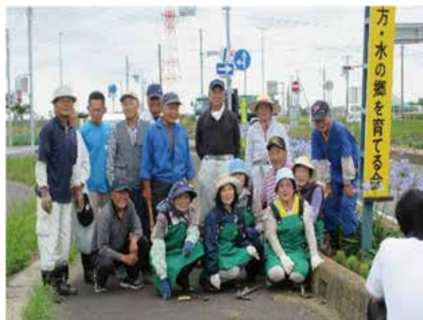
30年以上活動している「延方生活学校」