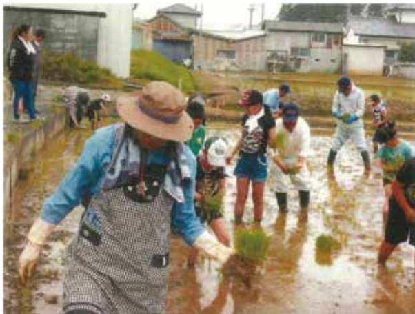
三世代交流事業（田植え体験）