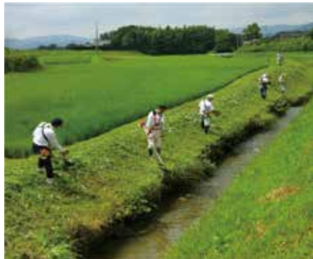
太田地区資源保全活動組織 (石岡市)