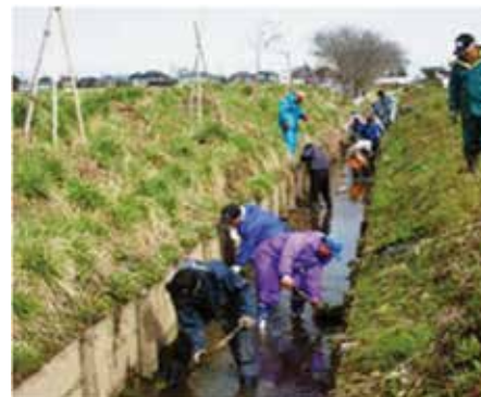
中結城東部地区資源保全協議会 (八千代町)