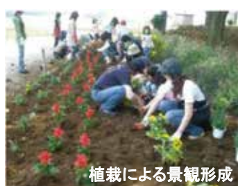
植栽による景観形成