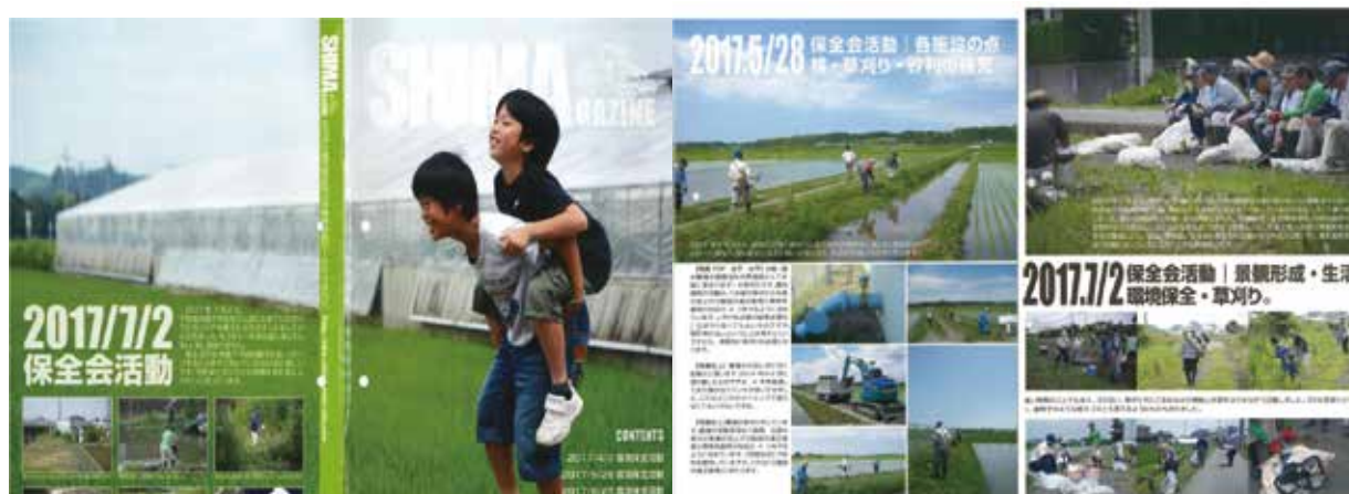
定期発行の広報誌「SHIMAgazine」