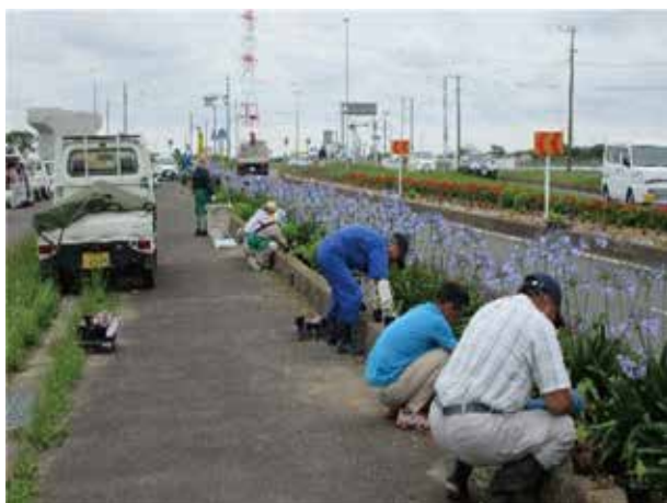
アガパンサスの植栽