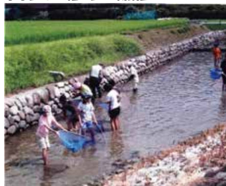
玉川沿岸地域資源保全活動組織 (常陸大宮市)