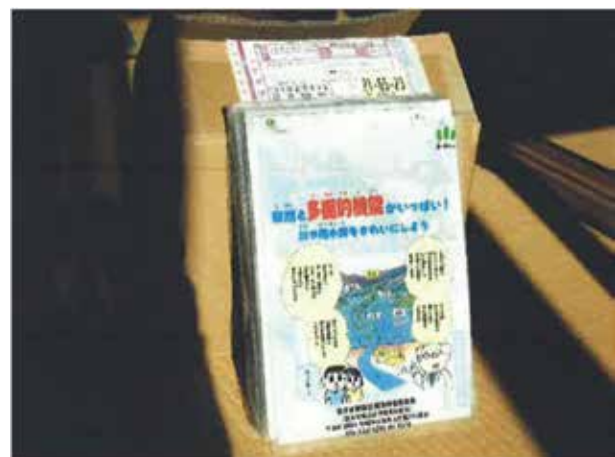
広報資料（クリアファイル）の作成