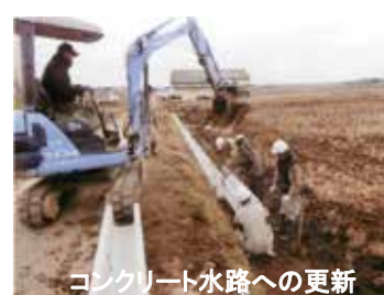
コンクリート水路への更新