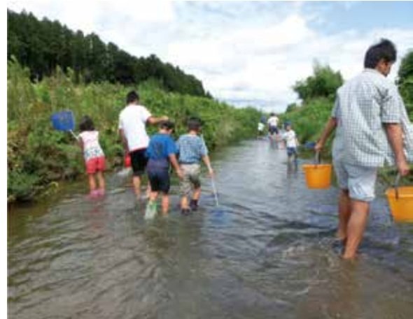
ふるさとの生き物調査