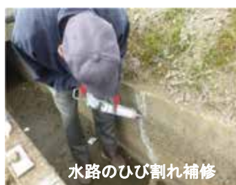
水路のひび割れ補修