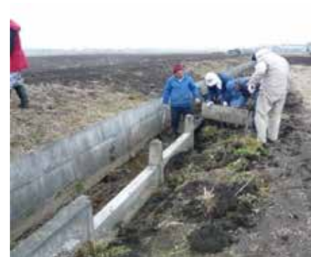
瓜連環境保全クラブ (那珂市)