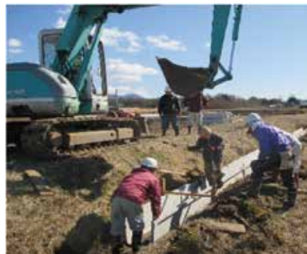
古都環境保全協議会 (筑西市)