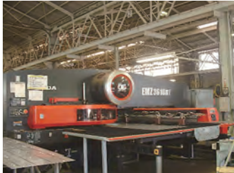
材料加工 (株)田代工業所