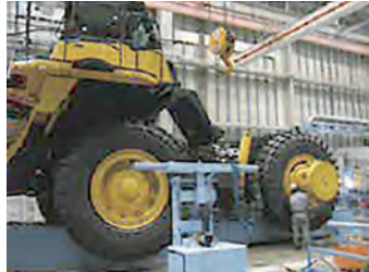
組立 (株)コマツ製作所