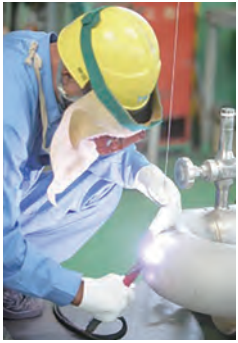
TIG溶接 (大陽日酸東関東(株))