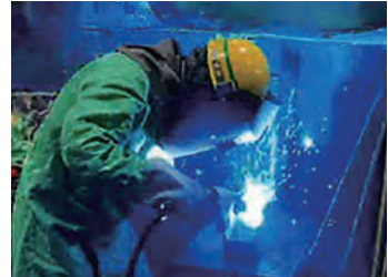
半自動溶接 (日立建機(株))